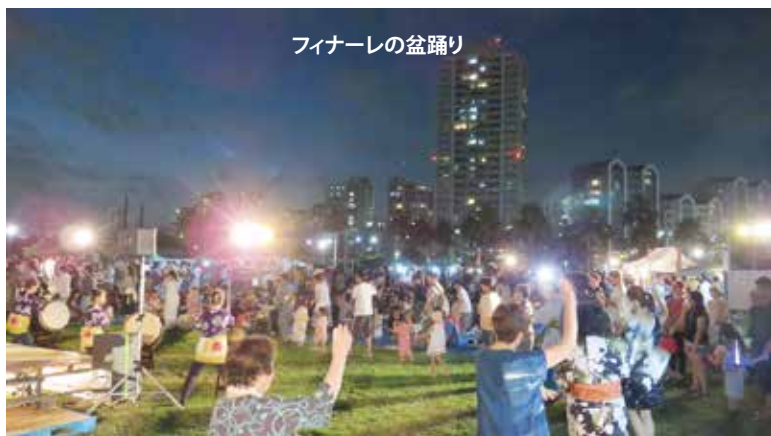
フィナーレの盆踊り

マンションの開発が始まってから爆発的に増えた住民による新しい試みや、街づくりが、年々盛大になってくるとはとても良いことのように思います。